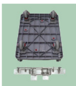
02 フットストッパーを用意する