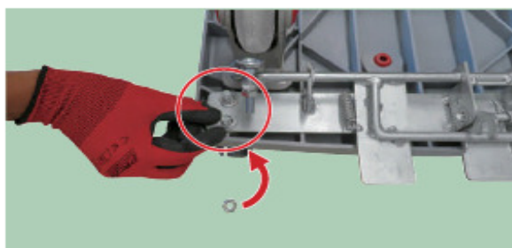
05 ワッシャー、スプリングワッシャー、ナットの順に取付箇所セットする