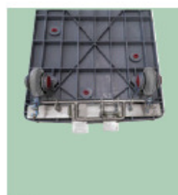
07 フットストッパー取付完成