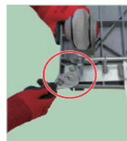
06 ナットをしっかり締める