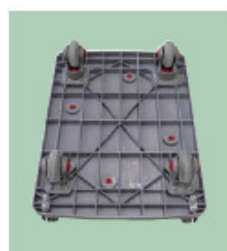
01 台車を裏側に置く