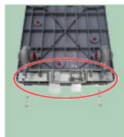
04 フットストッパーを写真のように置く