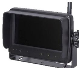
7インチ防水モニター